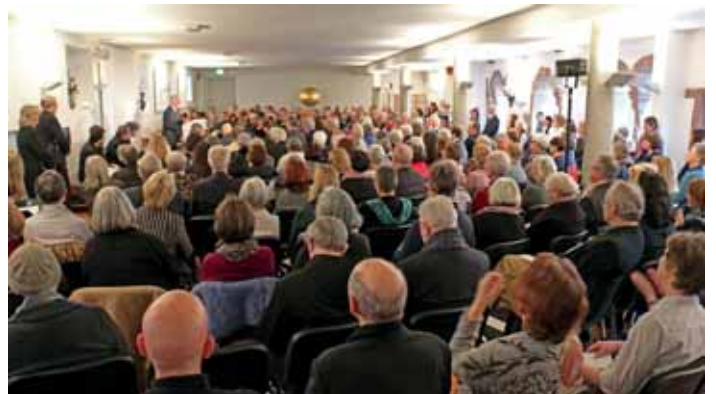
Über 350 Gäste kamen zum Festakt anlässlich des 90. Geburtstag von Willigis Jäger