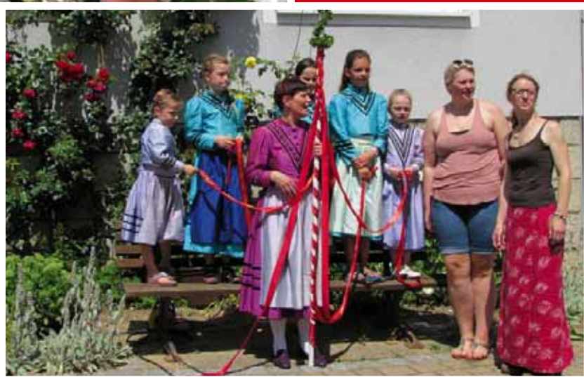
Die Trachtenfrauen beim Pfingstmarkt 2014

„Etwas pflanzen, heißt, an die Zukunft zu glauben“