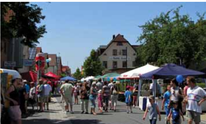
Impressionen vom Markt am Pfingstmontag 2014

Schon jetzt ein von Herzen kommendes „Vergelt's Gott“ dafür!!