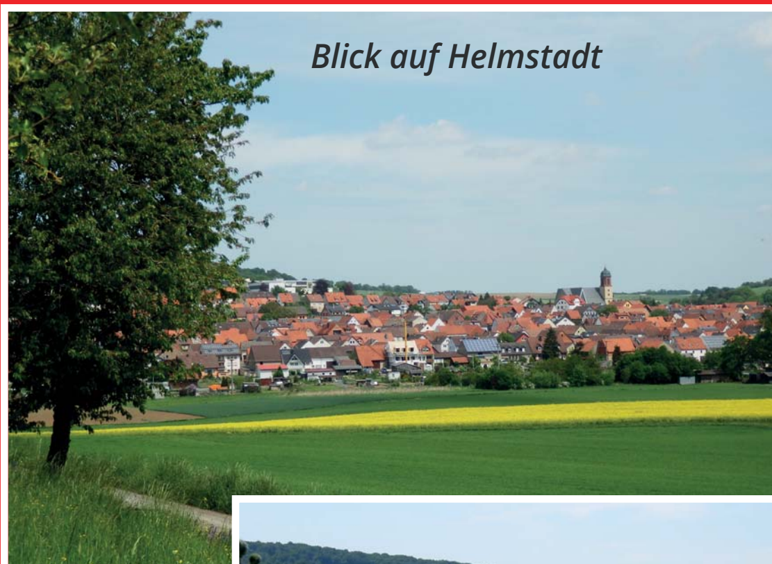
Blick auf Helmstadt