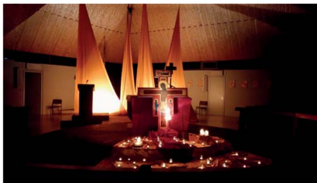
Gebet mit meditativen Gesängen und Texten aus Taizé