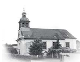
ST. ÄGIDIUS - Holz Kirchhausen