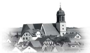
ST. MARTIN - Helmstadt