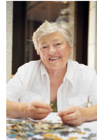
© Fancy / F1online / Assisted Living

Machen Sie mit bei der Einkommens- und Verbrauchsstichprobe 2013!